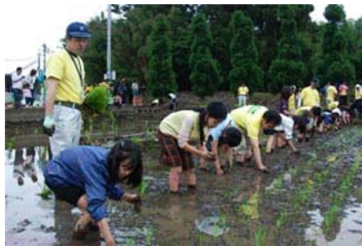
田植えのようす(あぐりスクール)