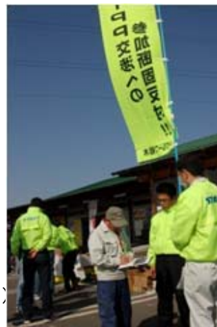
TPP交渉参加反対署名運動