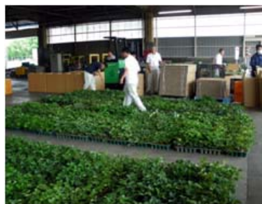
被災地へのイチゴ苗発送準備